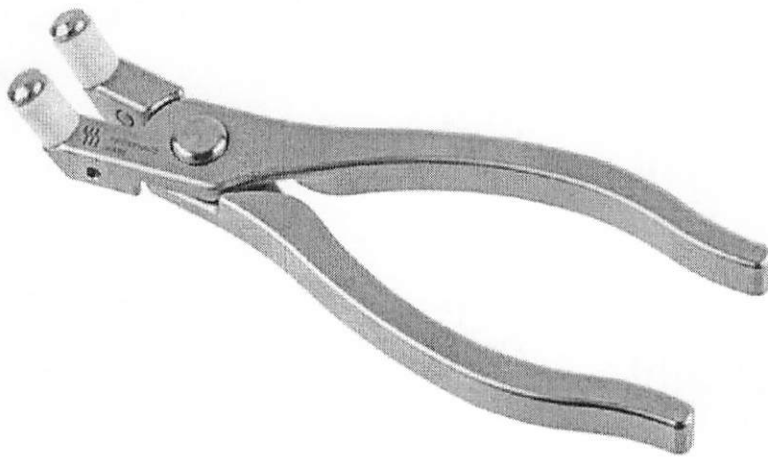
Pinza selladora o rodillo para el área de Banco de Sangre