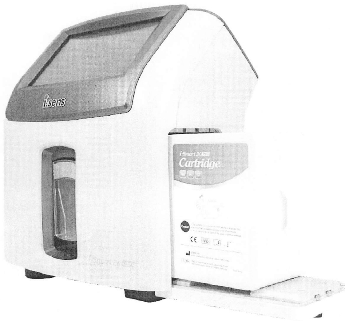
Equipo de electrolitos séricos (no requiere mantenimiento)